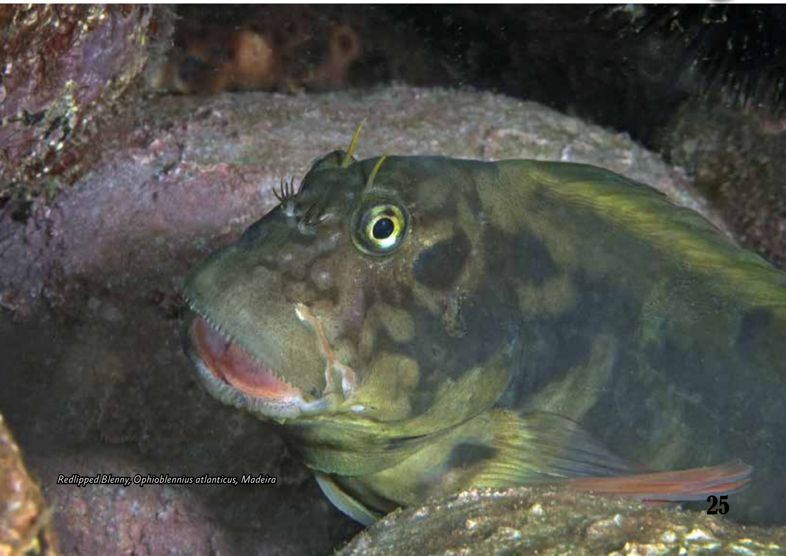
Redlipped Blenny, Ophioblennius atlanticus, Madeira