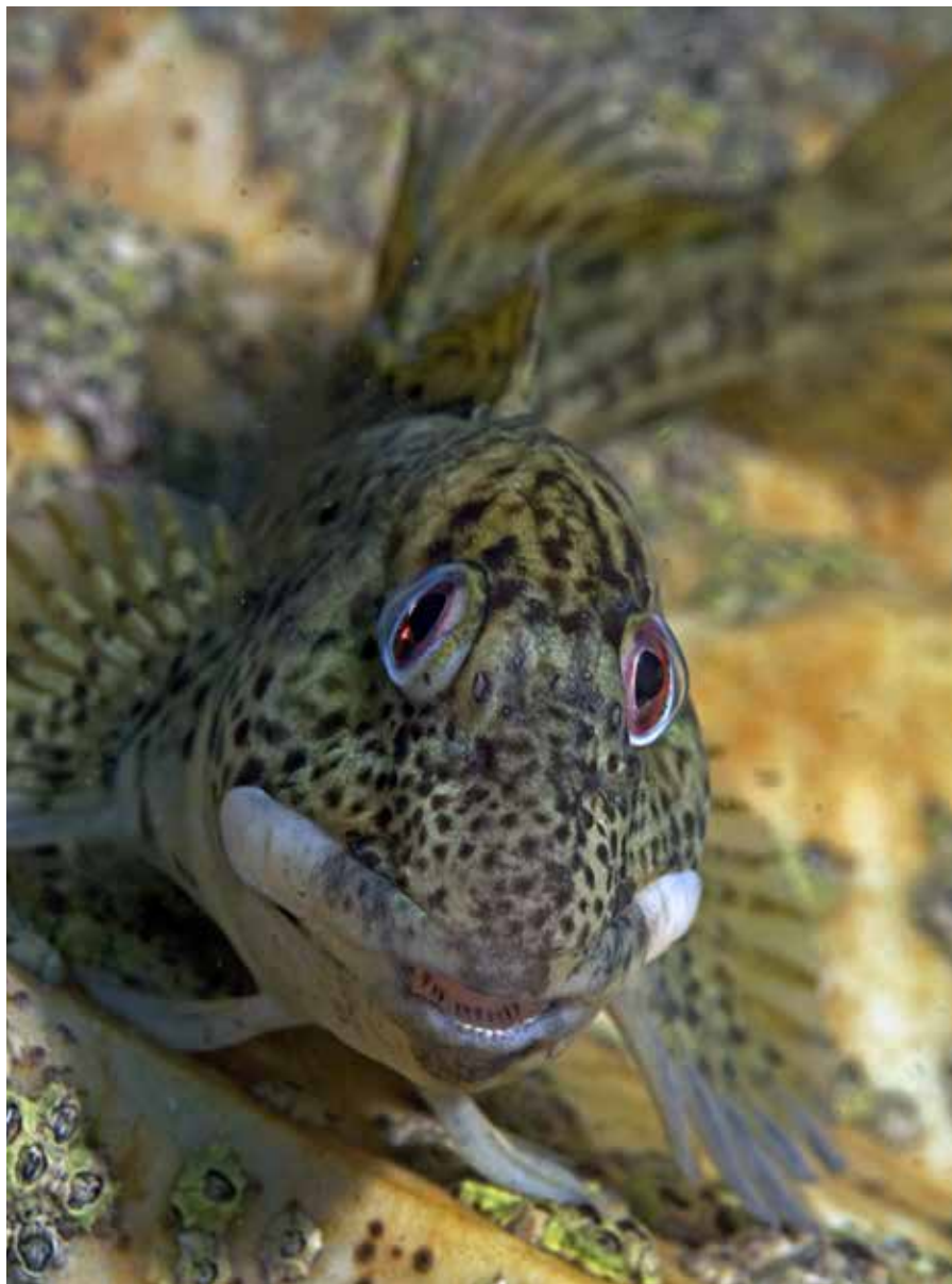
Slijmvis, Liphrophrys pholis, Bretagne

Grondels en slijmvissen zijn nauw met elkaar verwant en voor de leek moeilijk uit elkaar te houden. Grondels zijn van het geslacht Gobius in de familie van de zeegrondels (Gobiidae), die weer behoort tot de orde van baarsachtigen ( Perciformes ). Slijmvissen ( Labrisomidae ) zijn een familie van baarsachtige vissen. Ze worden voornamelijk aangetroffen in tropische gebieden in de Atlantische en Grote Oceaan en de familie omvat ongeveer 98 soorten. Veel soorten uit deze familie zijn felgekleurd. De grootste soort kan 30 centimeter lang worden, maar de meeste slijmvissen zijn veel kleiner. Ze blijven gewoonlijk in ondiep kustwater tot een diepte van ongeveer 10 meter. Ze vinden hun voedsel op de bodem, waar ze gewoonlijk ook blijven. Ze voeden zich met kleine kreeftjes en garnalen, slakken, slangsterren en zee-egels. Ik vind het parmantige visjes. Vaak staan ze op hun voorvinnen naar je te kijken. Nieuwsgierig als ze zijn en altijd op zoek naar voedsel, komen ze dichtbij. Want ze weten dat ze razendsnel kunnen wegschieten!