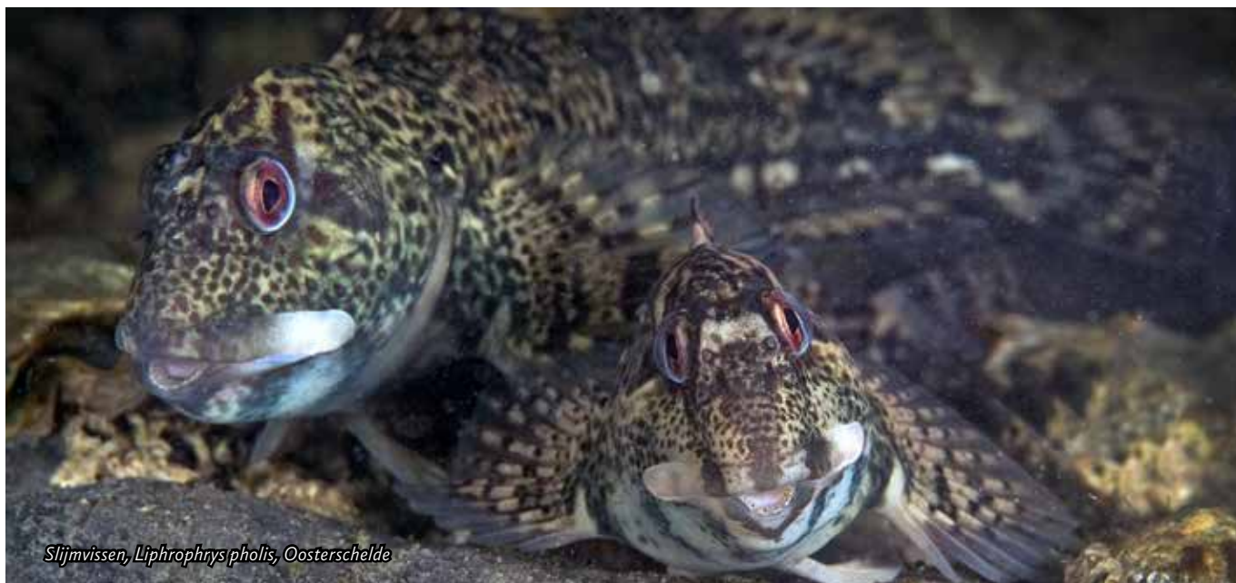
Slijmvissen, Liphrophrys pholis, Oosterschelde

Ze staan op de Rode Lijst van bedreigde diersoorten omdat ze specifieke eisen stellen aan hun omgeving, en die ondiepe kustgebieden worden bedreigd door bebouwing en vervuiling. Ze houden van helder water en een rotsachtige bodem. Daar is genoeg van op Madeira.