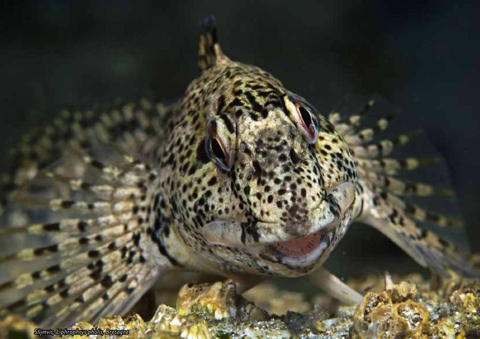
Slijmvis, Liphrophrys pholis, Bretagne

De eerste keer dat ik ze in het buitenland zag was in Cornwall, maar ze schoten steeds weg tussen de stenen in de branding. De visjes zijn perfect gecamoufleerd. Ik zag ze eigenlijk pas als ze bewogen. En dan maakten de oceaangolven het me ook nog moeilijk. Eigenlijk begrijp ik helemaal niet hoe ze zo rustig blijven zitten in de branding. Ik moet de grootste moeite doen om op mijn plek te blijven en zij kijken me lachend aan. Het lijkt wel of ze op de stenen geplakt zitten. In Bretagne vond ik deze zomer grote steenslijmvissen. Bij hoogwater zaten ze op de rotsen. Ik hoefde maar een keer met mijn handen over de zeepokken op de stenen te strijken, en ze kwamen dichterbij! Ze gingen zelfs op m'n hand zitten, totaal niet bang en ook nog midden op de dag! Geen wonder dat het mijn lievelingsvis is!