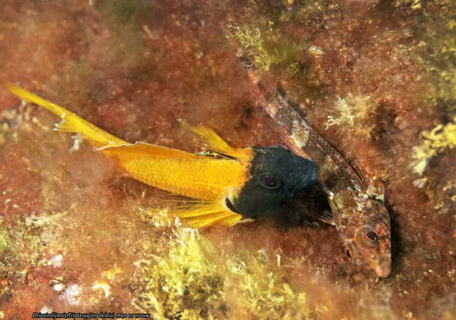
Drievislijmvis, Tripterygion delaisi, man en vrouw